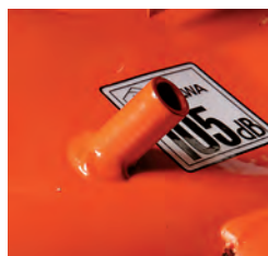
Dispositif de nettoyage plateau pour le branchement d'un tuyau d'arrosage