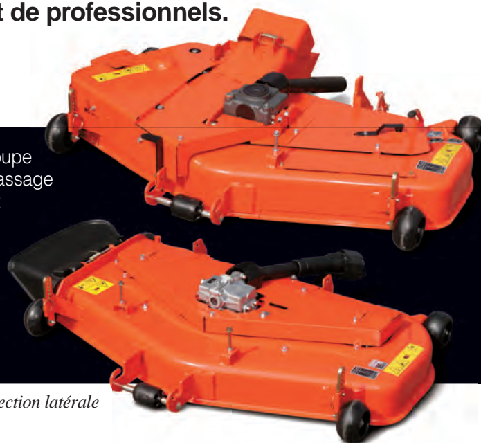
Plateau éjection latérale

Le système d'éjection directe des résidus de tonte garantit une coupe nette, et canalise leur évacuation instantanée dans le bac de ramassage intégré à l'arrière. La largeur de coupe de 1,22 m est parfaitement adaptée ; et en éjection arrière centralisée, la tonte serrée autour des arbres peut se faire aussi bien par la gauche que par la droite. Pour ceux qui préfèrent une éjection latérale, le plateau de coupe de la GR2120S est tout aussi performant et résistant, conçu en tôles épaisses, pour une profondeur de 12,7 cm. Vous obtiendrez donc toujours un résultat de professionnels quel que soit le système de coupe choisi, et cela saison après saison.