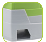
Granulométrie 35 mm