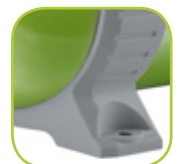
Pattes de fixation