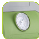
Manomètre de pression